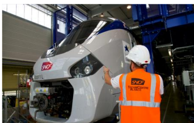
Atelier de maintenance SNCF à Mulhouse

La Région a attribué une subvention de 295 000 € pour réaliser des travaux de remise en état des plafonds des 44 Autorails de Grande Capacité (AGC) affectés au réseau TER en Champagne-Ardenne.