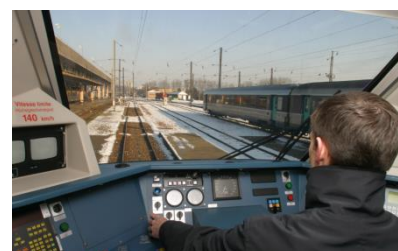
Poste de commande Régiolis