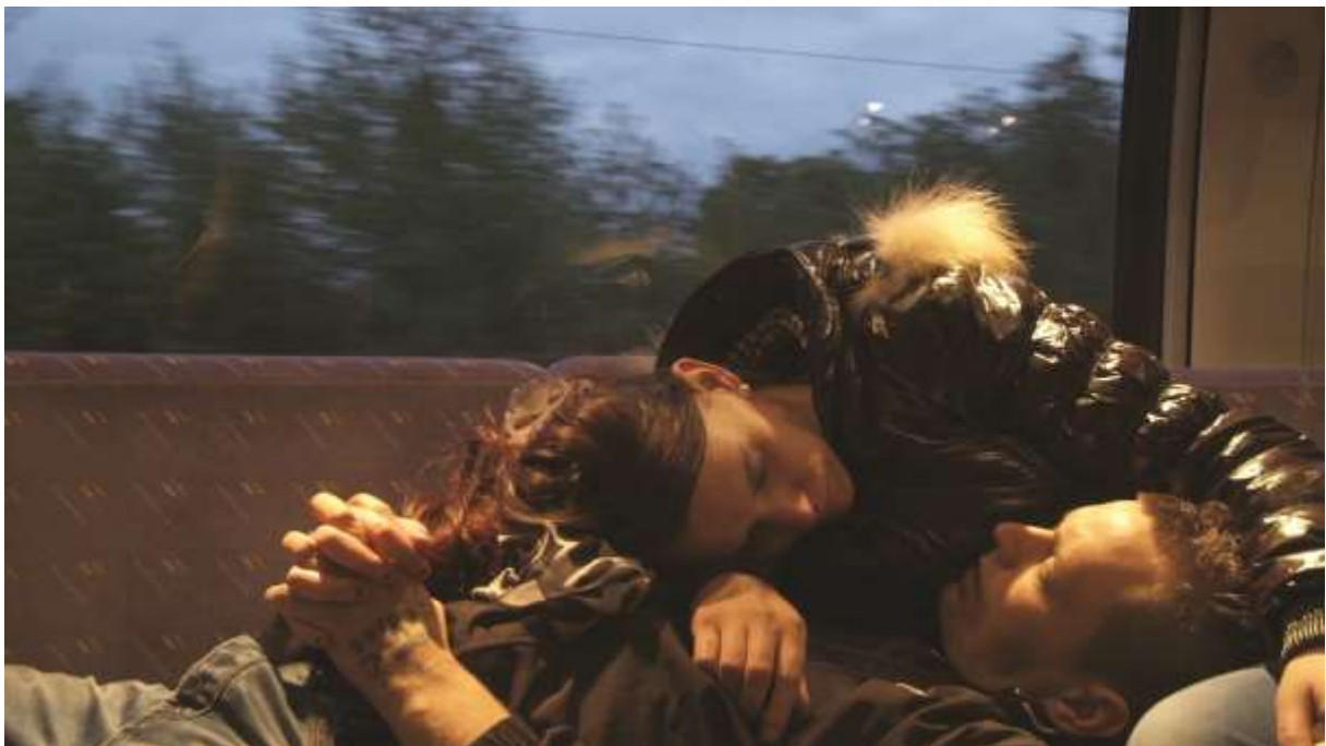
Marie Dumora/Gloria Films