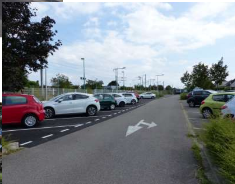
Zone de stationnement Sud