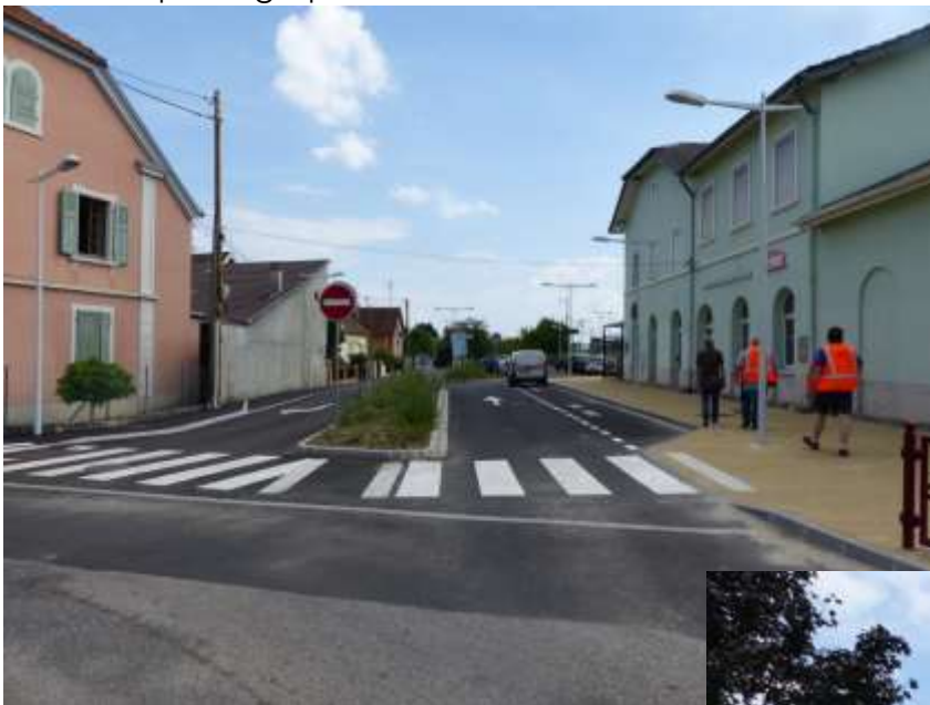
Parvis Nord de la gare (dépose-minute et accès à la zone de stationnement)