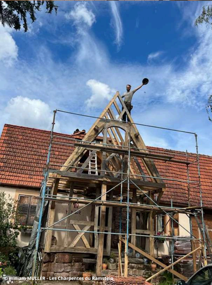
© William MÜLLER - Les Charpentes du Ramstein