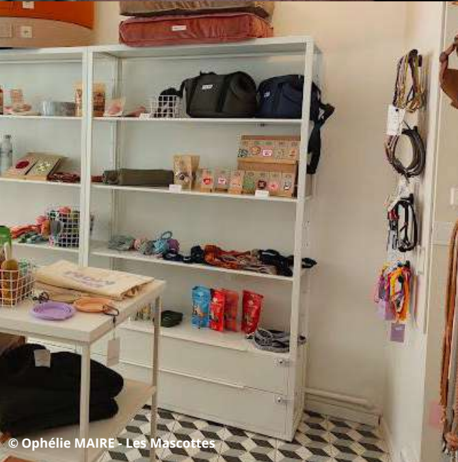
© Ophélie MAIRE - Les Mascottes