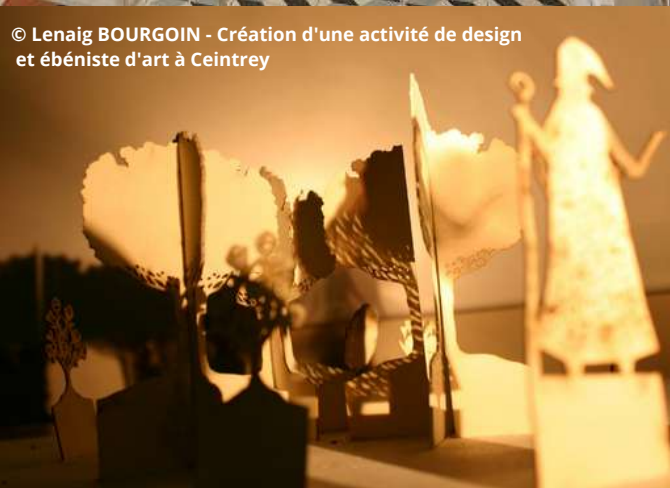
© Lenaig BOURGOIN - Création d'une activité de design et ébéniste d'art à Ceintrey