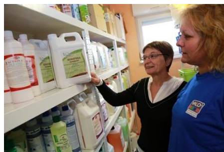
Scop Valo à Florange