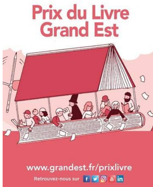
Illustration de Simon Bailly, diplômé de l'Ecole Supérieure d'Art d'Epinal