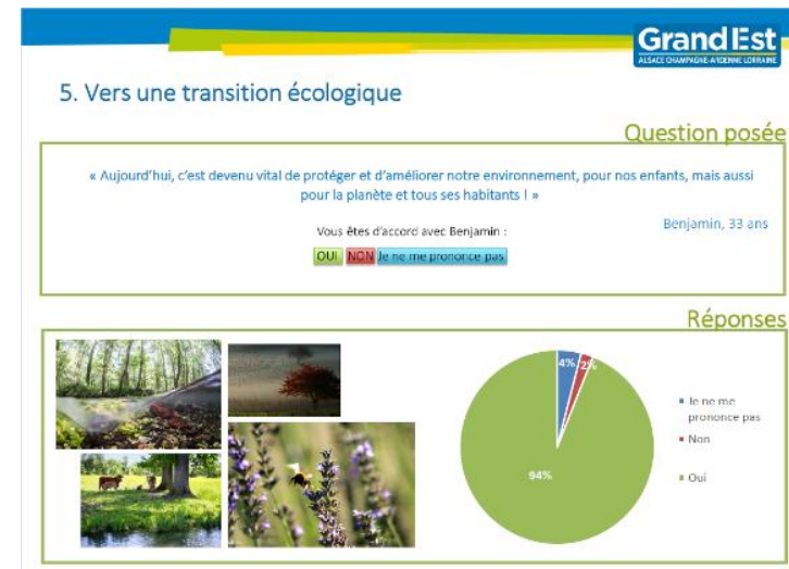
Extrait du bilan de la consultation citoyenne

Enfin un bilan qualitatif et quantitatif de la consultation citoyenne a été diffusé sur le site internet de la Région Grand Est.