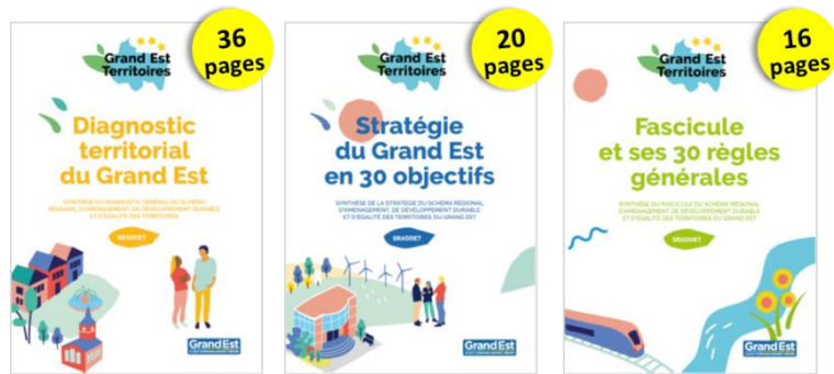
Les trois documents de synthèse du SRADDET