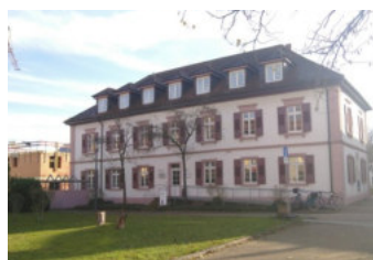
Villa Rehfus

Le 1 er octobre 2019, le Conseil Rhénan a créé à Kehl un secrétariat qui est cofinancé dans le cadre d'un projet INTERREG pour une durée initiale de trois ans. Le Landtag du Bade-Wurtemberg a accepté d'être le porteur de ce projet INTERREG.