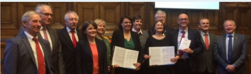
Signature de la Stratégie 2030 de la RMT à Bâle

Le Conseil Rhénan et la Conférence du Rhin supérieur sont intervenus conjointement auprès des ministères allemands et français compétents pour demander l'amélioration des transports ferroviaires dans le Rhin supérieur, une étape stratégique pour l'intégration de la région frontalière. Il s'agit notamment de financer la réactivation des liaisons ferroviaires historiques Colmar-Freiburg et Sarrebruck-Haguenau-Rastatt-Karlsruhe.