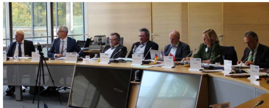
Réunion du Bureau du 25/10/2019 à Strasbourg