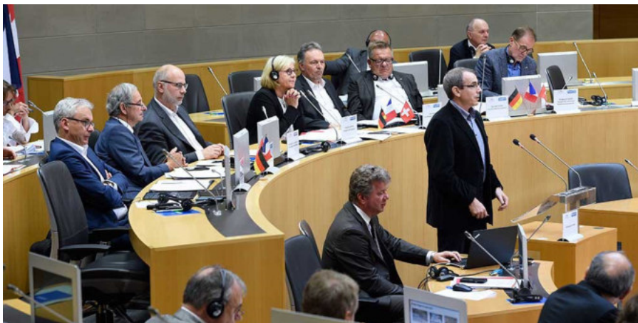
Séance plénière du 07.06.2019 à Strasbourg

La 1 ère Séance plénière a donné lieu à des discussions autour de thématiques centrales pour le quotidien des citoyens de la région du Rhin supérieur : l'intelligence artificielle, l'environnement, les transports, le sport et la culture.