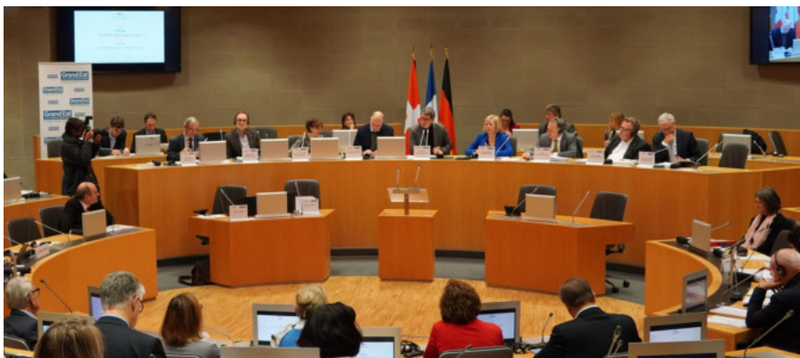
Séance plénière du 20.12.2019 à Strasbourg