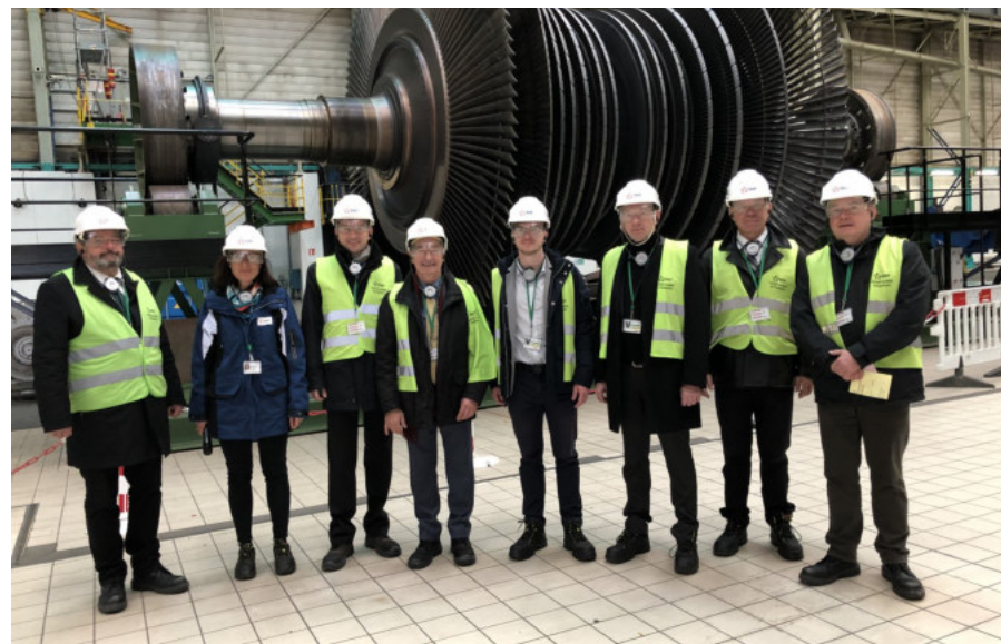
Visite de la centrale nucléaire de Fessenheim par la Commission le 18.11.2019