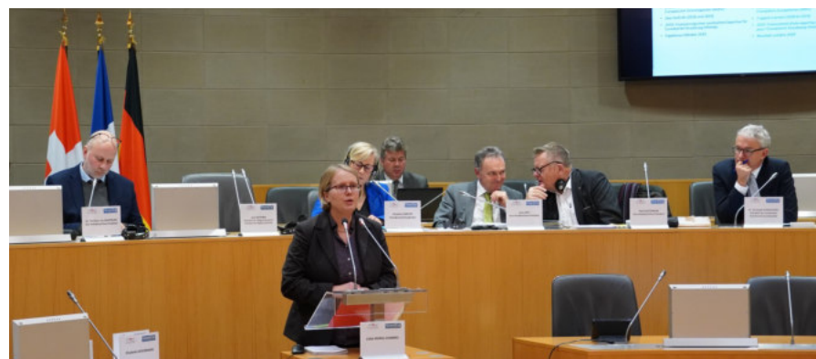
Présentation de l'Eurodistrict Strasbourg-Ortenau le 20.12.2019 à Strasbourg