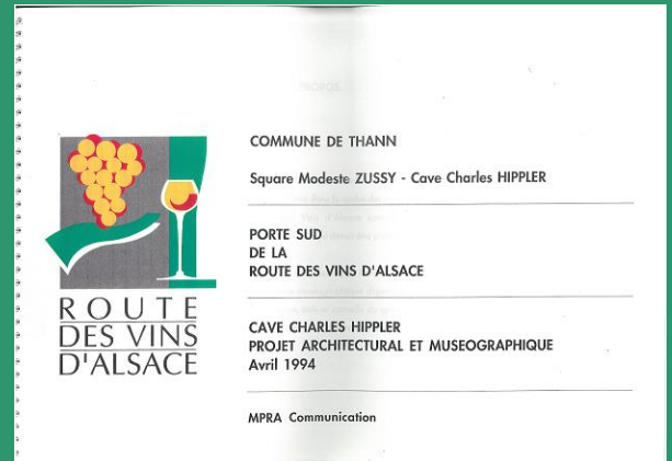
Projet architectural pour la porte sud de la route des Vins (1994). Archives de la Région Grand Est, site de Strasbourg, 1885 WR 54 (2).

Les anniversaires successifs de la route des Vins ont été l'occasion de développer de nouveaux projets. Le 40 e anniversaire, célébré avec un peu de retard en 1994, a permis la création d'un nouveau logo et la mise en place d'une signalétique spécifique. Il a également été décidé d'aménager deux portes de la route des Vins, à Marlenheim au nord et à Thann au sud. Ces deux espaces privilégient l'accueil des hôtes du vignoble alsacien, les informent sur l'itinéraire, les villages, les vins, les terroirs, les cépages. La porte nord est inaugurée le 23 septembre 1994 et la porte sud le 24 septembre.