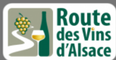
Logo actuel de la route des Vins