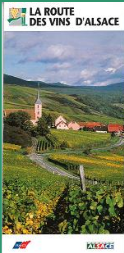
Dépliant « La route des vins d'Alsace » avec le nouveau logo (1994). Archives de la Région Grand Est, site de Strasbourg, 1950 WR 9 (2).