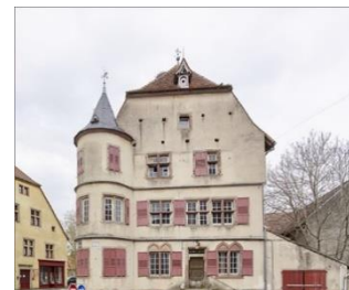
Fénétrange, la maison des « Fers », Région Grand Est - Inventaire général - ©Bertrand Drapier