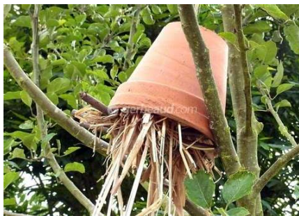
Abri pour forficules (perce-oreilles)