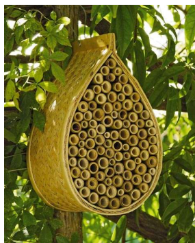
Abri pour abeilles solitaires