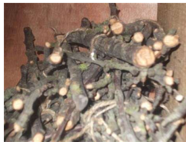
Abri pour les carabes