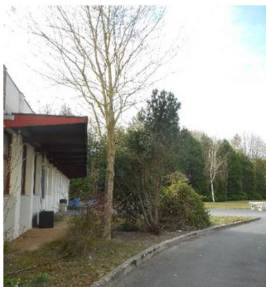
Massif pérenne en limite de bâtiment