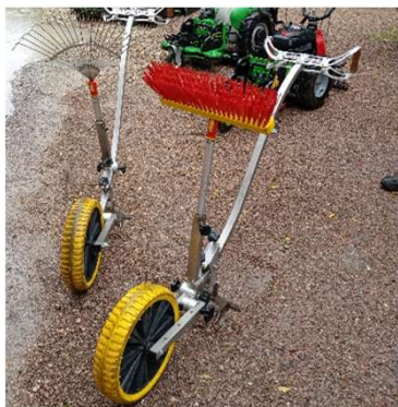
Matériel de désherbage