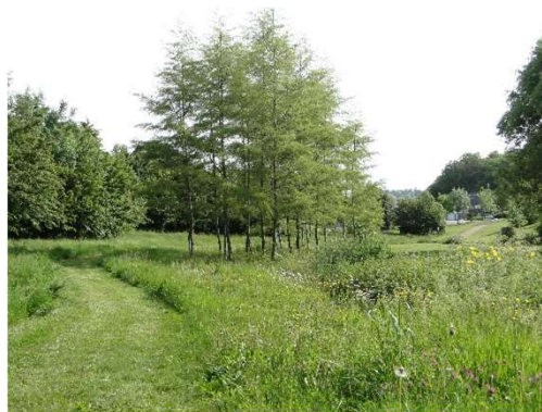
Gestion différenciée d'un espace enherbé

Ce document apporte une vision globale des espaces à gérer tout en intégrant des objectifs de réduction voire de suppression de l'utilisation des produits phytosanitaires.