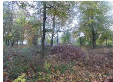
Lycée JJ Henner d'Altkirch (68)

CLASSE 1 : « ESPACE DE PRESTIGE » (par ex : entrée du lycée)