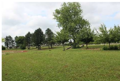
Lycée de Somme-Vesle (51)