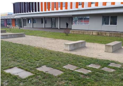
Lycée des métiers du bâtiment à Metz (57)

L'objectif étant de définir trois classes d'entretien maximum allant graduellement d'un entretien très horticole à forte exigence, à un entretien extensif à la gestion plus minimaliste. Le but de ce classement est de donner une ligne directrice pour l'entretien d'un espace.