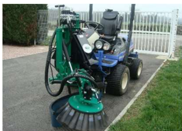
Bras de balayeuse sur micro-tracteur