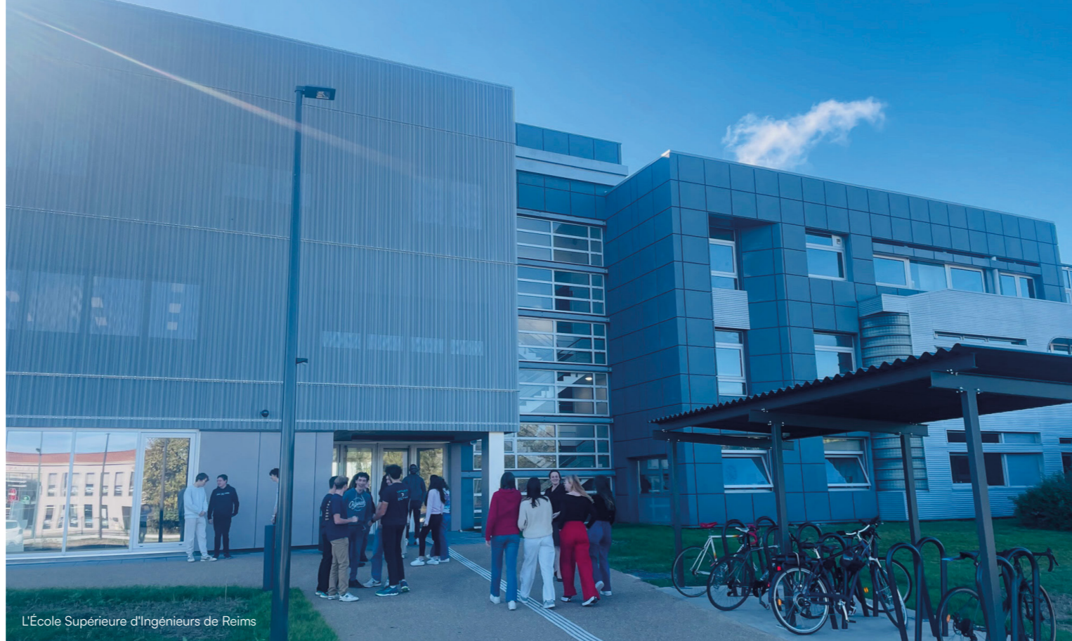
L'École Supérieure d'Ingénieurs de Reims