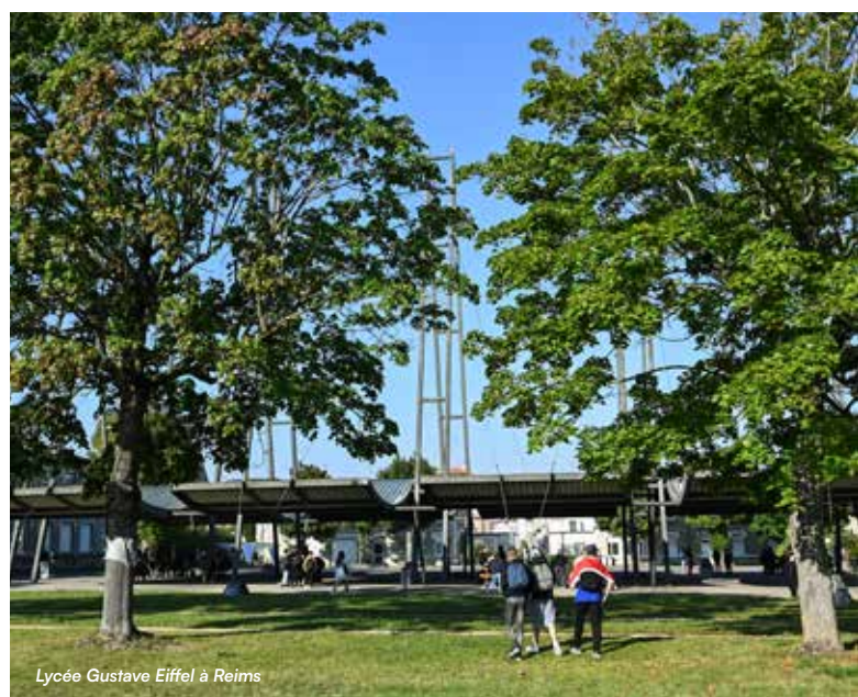
Lycée Gustave Eiffel à Reims

En créant des lieux de formation résolument durables et responsables, la Région prépare les futurs professionnels à relever — dans les meilleures conditions possibles — les défis de demain, tout en œuvrant activement pour un avenir plus écologique !