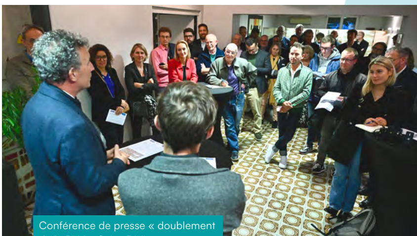
Conférence de presse « doublement de la RN4 à Saint-Dizier »