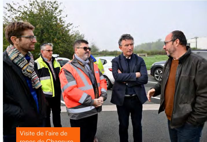
Visite de l'aire de repos de Chapsure