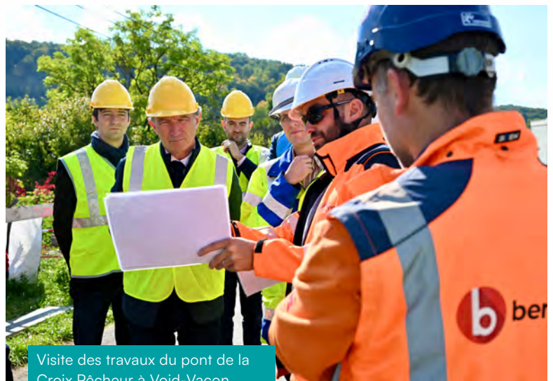
Visite des travaux du pont de la Croix Pêcheur à Void-Vacon