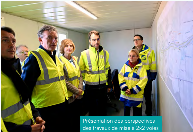
Présentation des perspectives des travaux de mise à 2x2 voies entre Gogney et Saint-Georges