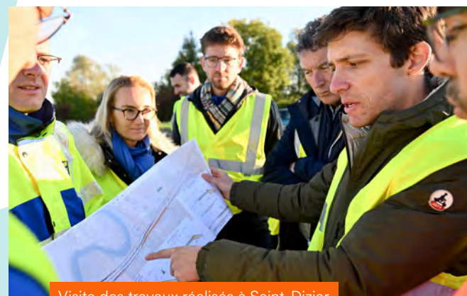
Visite des travaux réalisés à Saint-Dizier