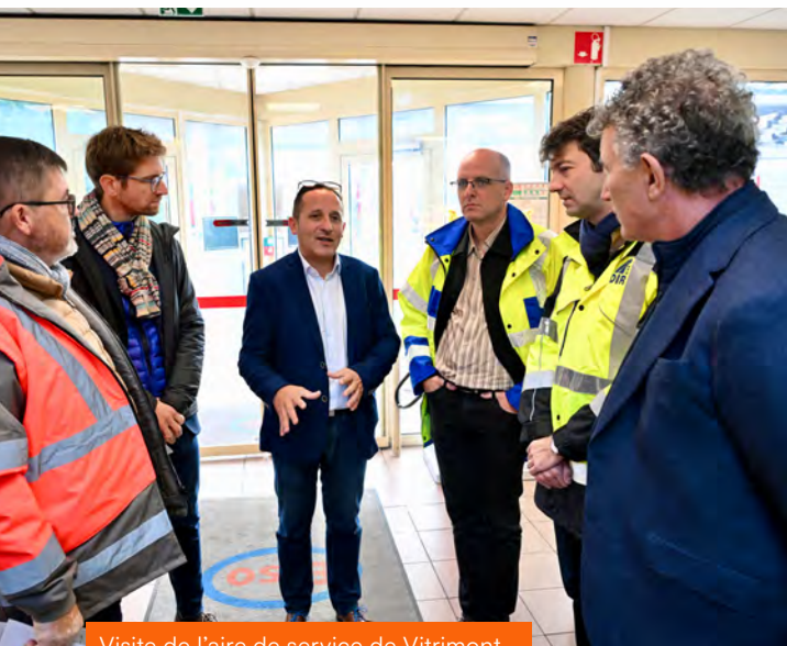
Visite de l'aire de service de Vitrimont