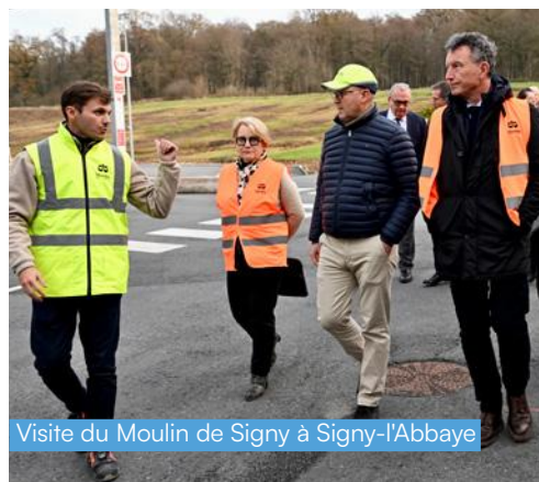
Visite du Moulin de Signy à Signy-l'Abbaye

Et grâce à la Région, commerçants et artisans modernisent leurs locaux et leurs matériels. Carreleurs, charpentiers, garagistes, restaurateurs, coiffeurs, boulangers... 120 commerçants et artisans ardennais ont été accompagnés au cours des dernières années.