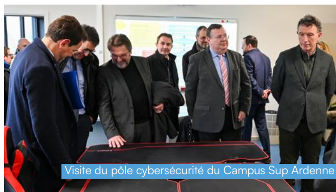
Visite du pôle cybersécurité du Campus Sup Ardenne

Au lycée Charles de Gonzague, à Charleville-Mézières , la Région a accompagné la restructuration des ateliers et la reconstruction de l'externat.