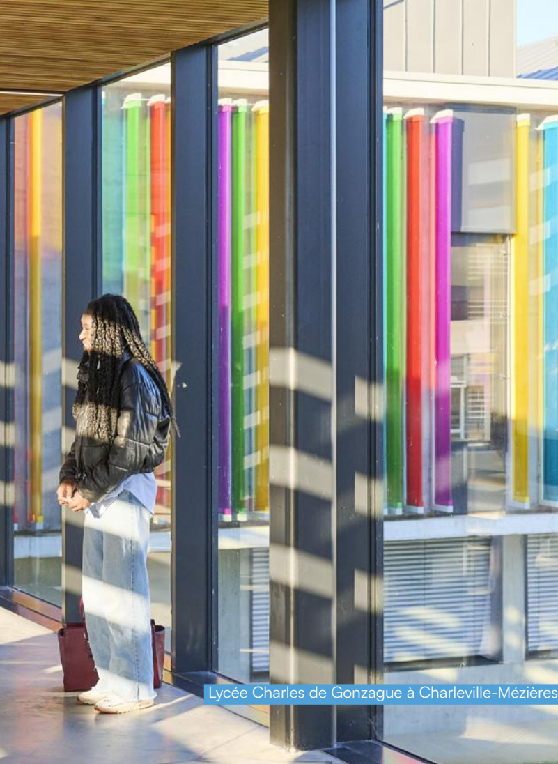
Lycée Charles de Gonzague à Charleville-Mézières