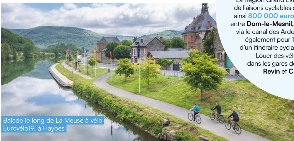
Balade le long de La Meuse à vélo Eurovélo19, à Haybes

Louer des vélos Fluo ? C'est possible dans les gares de Sedan , Rethel et bientôt Revin et Charleville-Mézières .