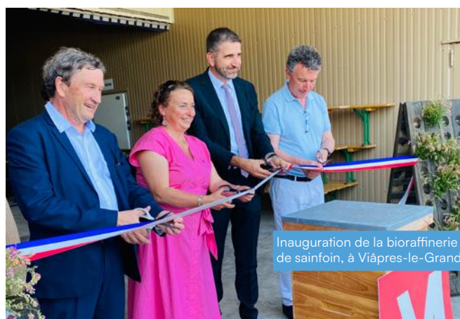
Inauguration de la bioraffinerie de sainfoin, à Viâpres-le-Grand

14 Maisons de Santé soutenues par la Région Grand Est depuis 2016.