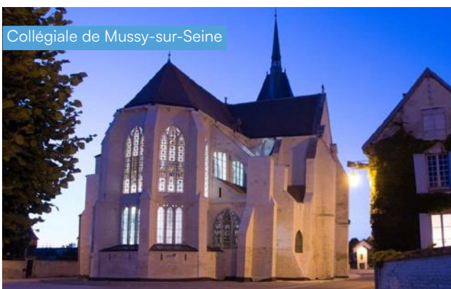
Collégiale de Mussy-sur-Seine