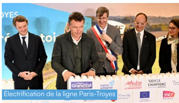
Électrification de la ligne Paris-Troyes

La Région a également contribué au financement de cinq rames Coradia Liner sur la ligne Paris-Troyes-Culmont-Chalindrey-Mulhouse , portant le parc à un total de 24 rames. Un investissement de 65 millions d'euros destiné à renforcer l'offre de trains sur cet axe ferroviaire stratégique.