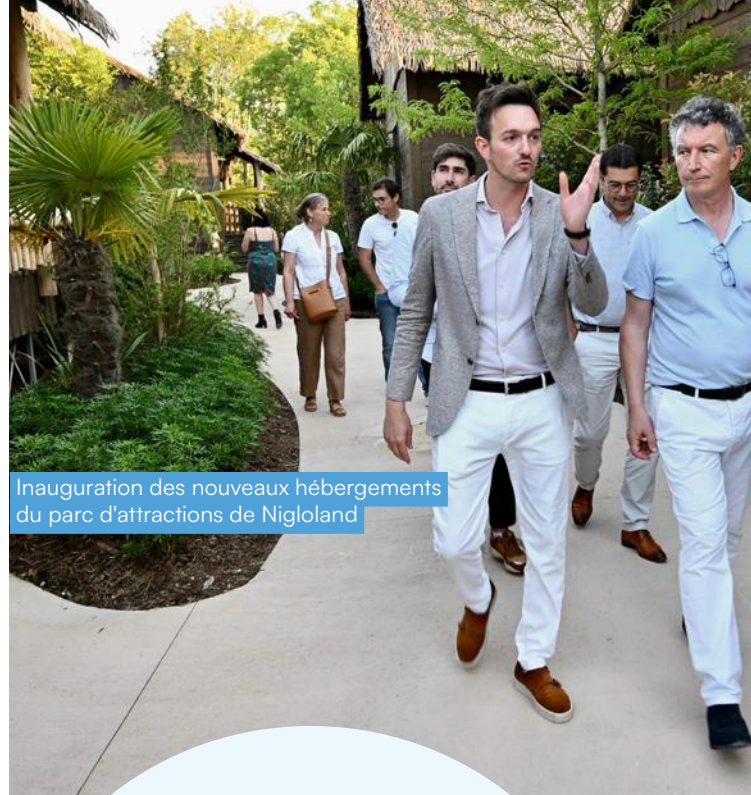
Inauguration des nouveaux hébergements du parc d'attractions de Nigloland