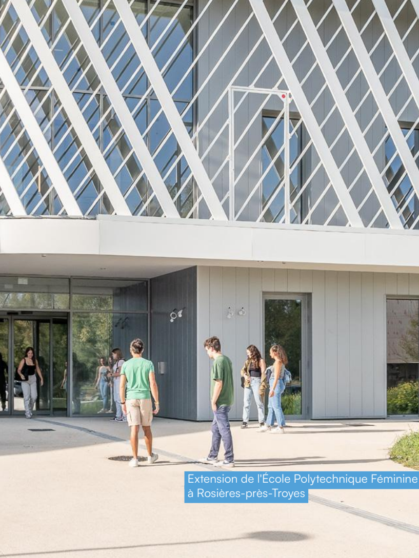
Extension de l'École Polytechnique Féminine à Rosières-près-Troyes