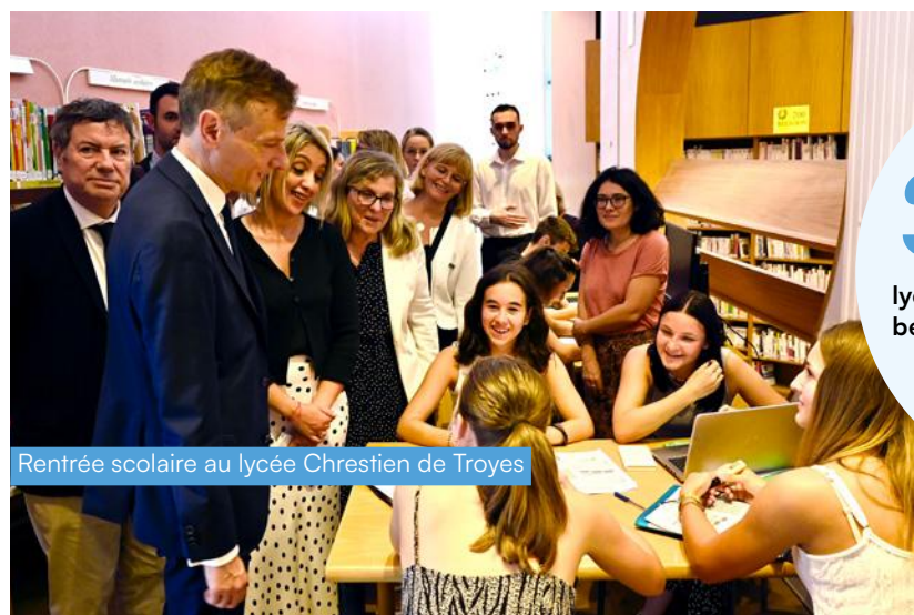
Rentrée scolaire au lycée Chrestien de Troyes

À Rosières-près-Troyes , l'École Polytechnique Féminine joue la carte de la diversité : 300 élèves dont 30 étudiants internationaux, un taux d'emploi des étudiants de 93 % et surtout plus de 35 % de jeunes femmes dans ses rangs. Cette forte représentation féminine est le marqueur de son identité. La Région Grand Est a investi 2,2 millions d'euros dans l'extension de l'EPF, l'une des premières grandes écoles françaises à former des femmes aux métiers d'ingénieurs.