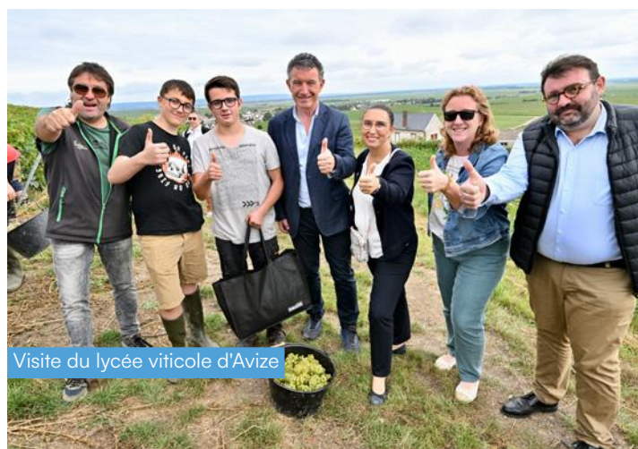
Visite du lycée viticole d'Avize

Côté équipements pédagogiques, la Région attribue plus de 375 000 euros au lycée Arago à Reims pour des matériels de topographie et de contrôles énergétiques.