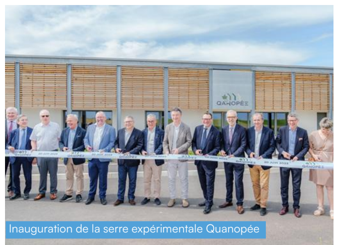
Inauguration de la serre expérimentale Qanopée

La serre expérimentale Qanopée est un projet majeur pour le vignoble mené au Mesnil-sur-Oger . L'objectif est de développer des plants de vigne dans une unité bioclimatique à l'abri des virus et des parasites et ainsi sécuriser l'avenir du vignoble. Ce programme inédit a mobilisé 4,8 millions d'euros en provenance des fonds européens et 417 000 euros de la part de la Région Grand Est.