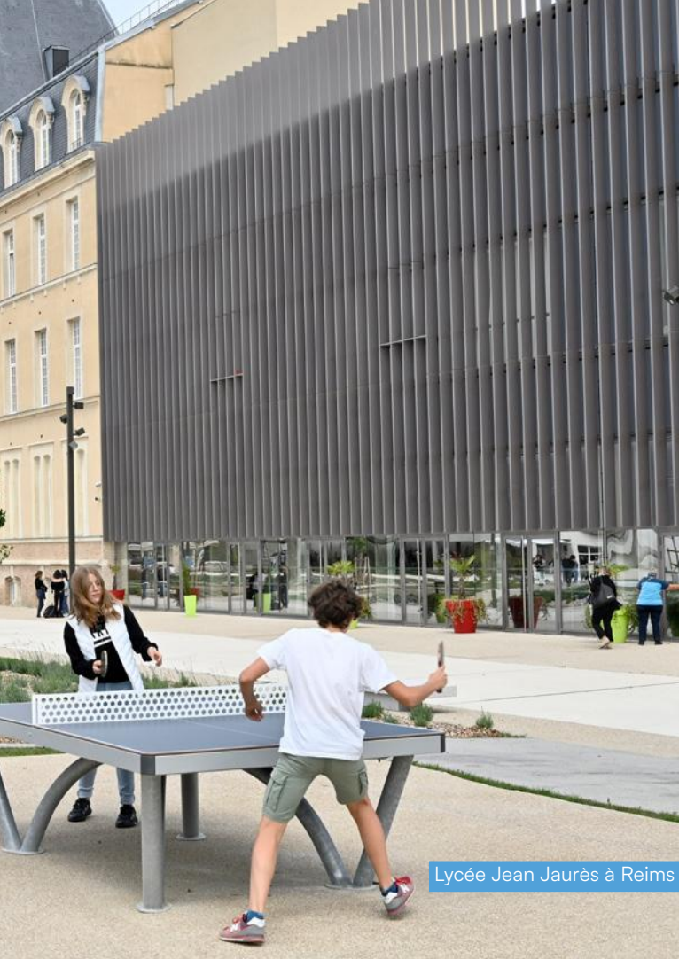
Lycée Jean Jaurès à Reims