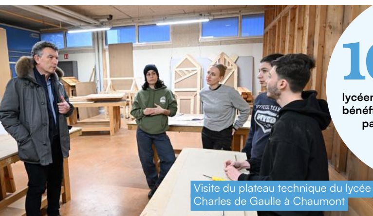
Visite du plateau technique du lycée Charles de Gaulle à Chaumont