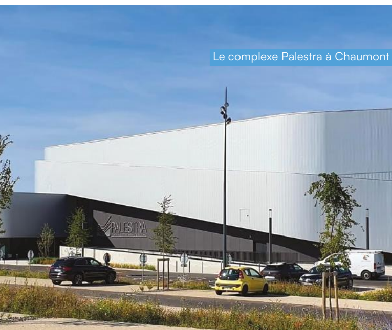
Le complexe Palestra à Chaumont

Centre aquatique, salle de sport, salle de spectacle : le complexe Palestra est tout cela à la fois. La Région Grand Est a engagé 2,9 millions d'euros et les fonds européens 400 000 euros au profit de cet équipement phare de l'agglomération de Chaumont .