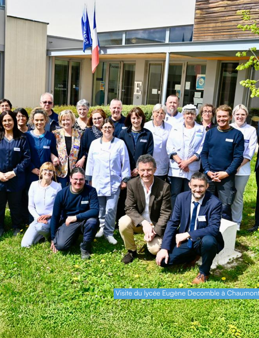
Visite du lycée Eugène Decomble à Chaumont