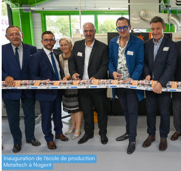
Inauguration de l'école de production Metaltech à Nogent