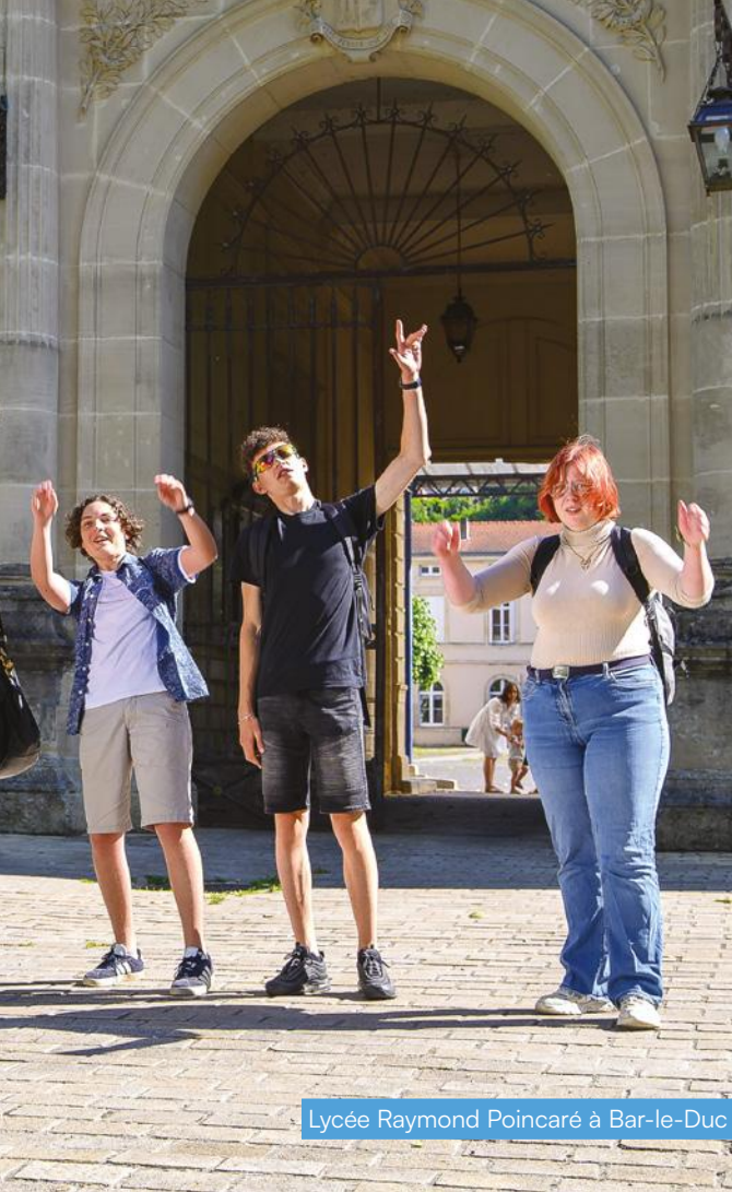
Lycée Raymond Poincaré à Bar-le-Duc