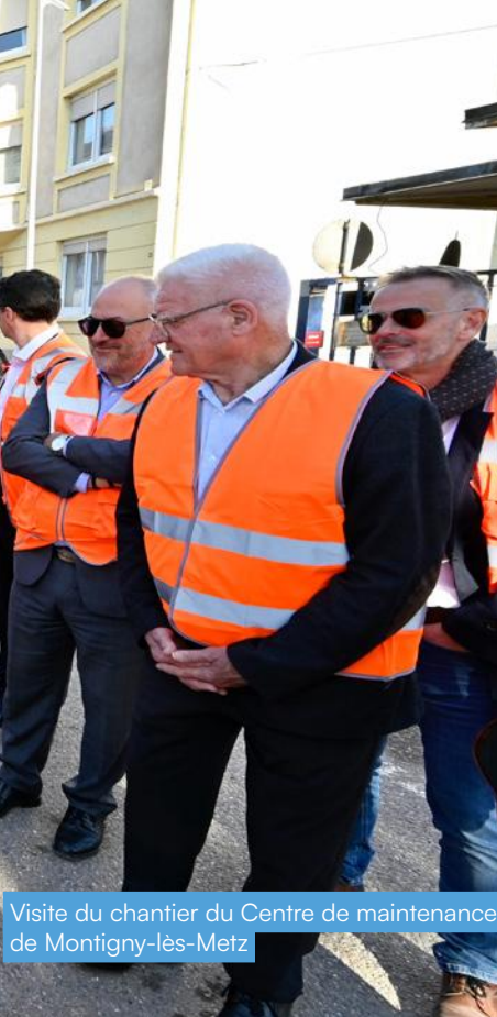
Visite du chantier du Centre de maintenance de Montigny-lès-Metz