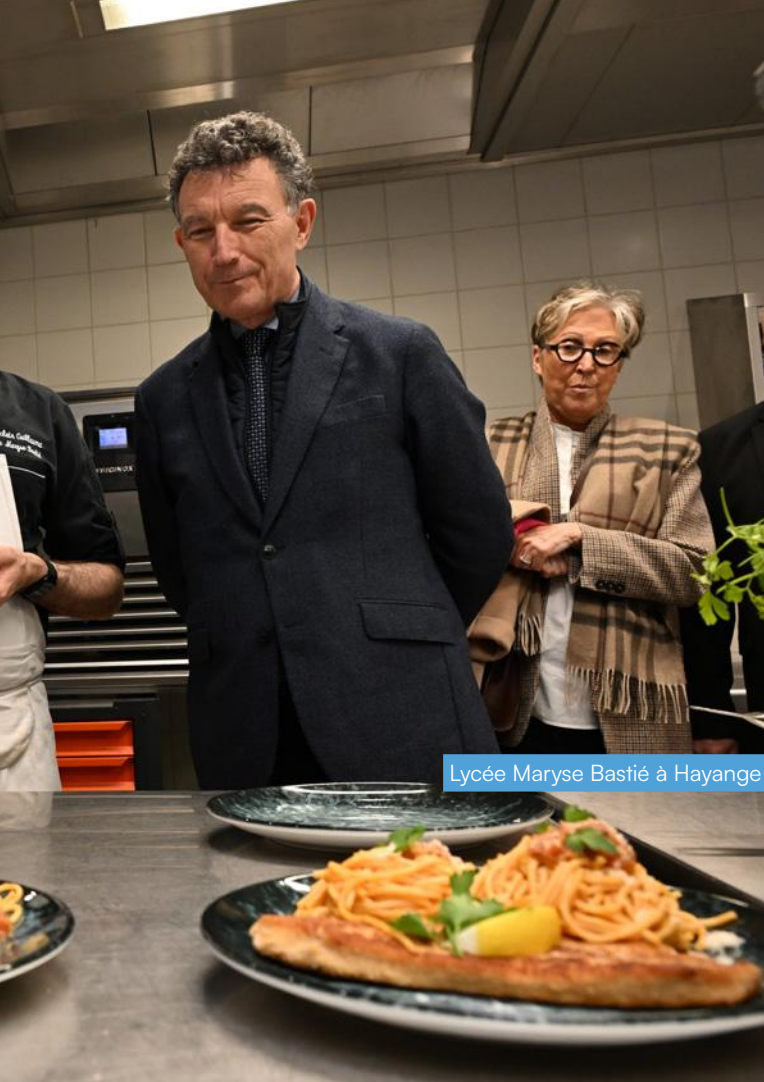
Lycée Maryse Bastié à Hayange