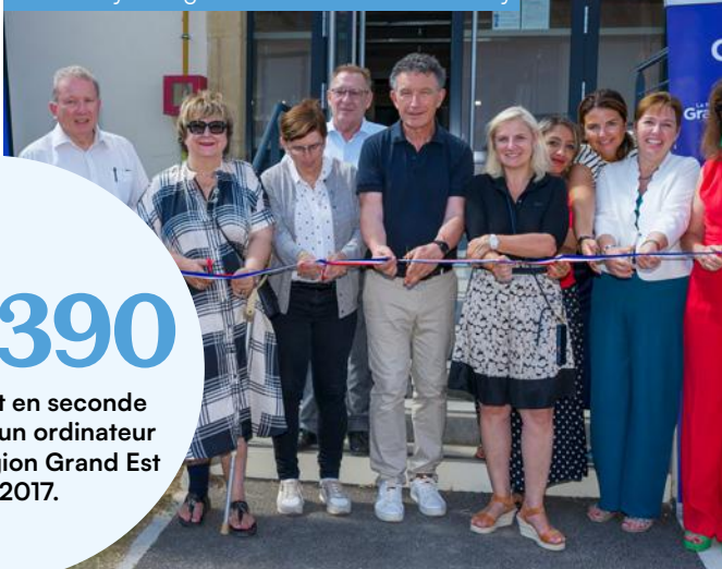
Visite au lycée agricole de Courcelles-Chaussy

La Région Grand Est engage 34 millions d'euros dans la restructuration du lycée professionnel Dominique Labroise. L'objectif est notamment de rénover les ateliers dédiés à la formation dans 3 métiers : verrerie, électricité et automobile.