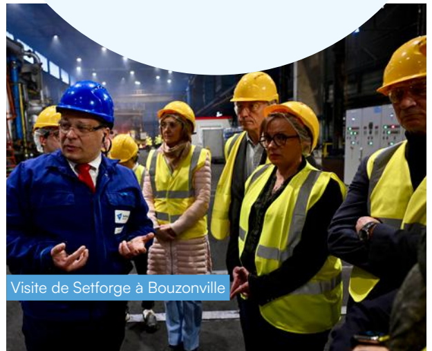
Visite de Setforge à Bouzonville

Le rachat en 2021 de Manoir Industries par le groupe Setforge, leader français de la forge, a redonné du souffle au site de Bouzonville . L'entreprise a été soutenue dans ses investissements : 2,2 millions d'euros de la Région et 500 000 euros de fonds européens. Autre exemple avec MOS-Laine, une entreprise spécialisée dans la transformation de la laine. L'aide de 500 000 euros de la Région Grand Est pour financer des équipements permet à la PME de Bataville de tisser sa toile autour des marchés des panneaux isolants, des feutres et de la laine en vrac destinée à l'emballage et au paillage.