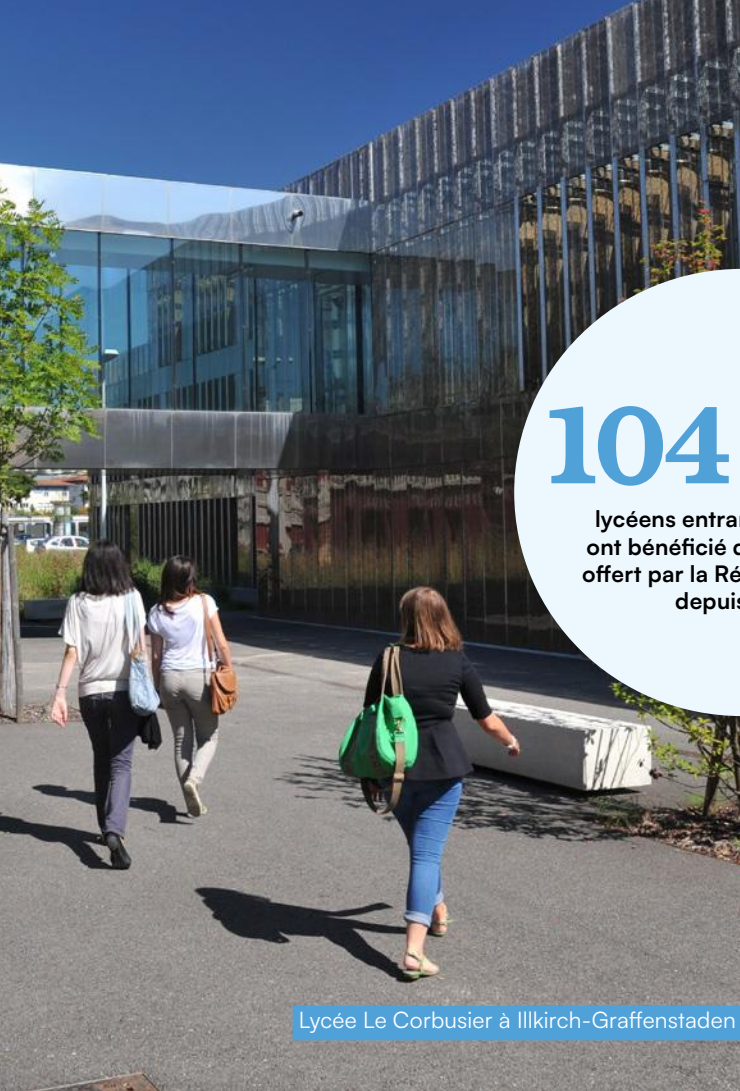
Lycée Le Corbusier à Illkirch-Graffenstaden