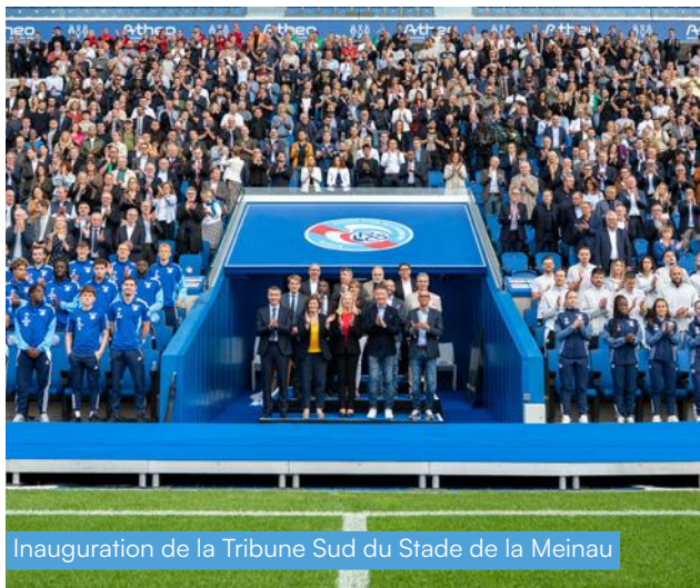
Inauguration de la Tribune Sud du Stade de la Meinau

Véritable locomotive du sport dans la région, le Racing-Club de Strasbourg Alsace a changé de dimension avec la rénovation du stade de la Meinau. Un projet soutenu par la Région qui a engagé plus de 37 millions d'euros . Dans le sillage de ce club phare, d'autres équipements montent en gamme accompagnés par la Région et les fonds européens: 4,7 millions d'euros pour la halle d'athlétisme du CREPS, 760 000 euros pour le nouveau centre aquatique de Mutzig , près de 3 millions d'euros pour la construction du complexe sportif Charlemagne à Sélestat .