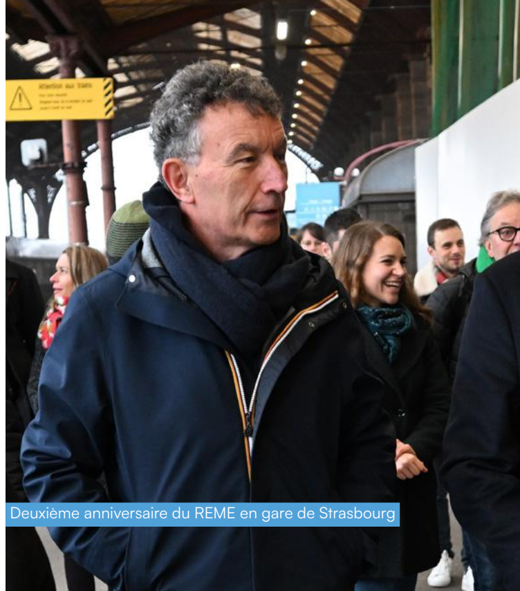
Deuxième anniversaire du REME en gare de Strasbourg

+12% de fréquentation dans les TER depuis 2019.