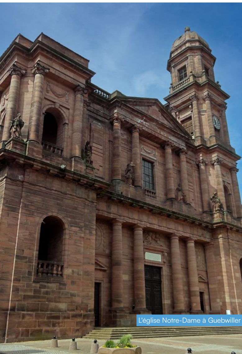
L'église Notre-Dame à Guebwiller