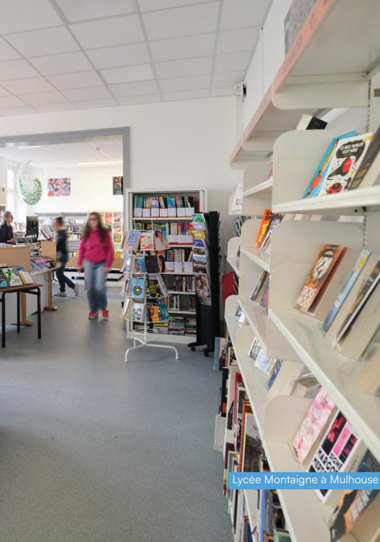
Lycée Montaigne à Mulhouse