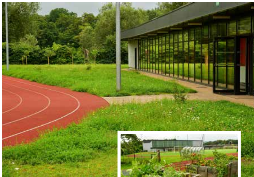
A travers le projet « Mon lycée se met au vert », le lycée CORMONTAIGNE à METZ a placé la biodiversité au cœur de son action : prairie fleurie près du stade, espaces enherbés plus sauvages, potager pédagogique....